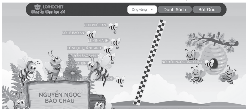
Hình 1: Tổ chức trò chơi BeeRace khi dạy văn bản “Đường đời đầu tiên”